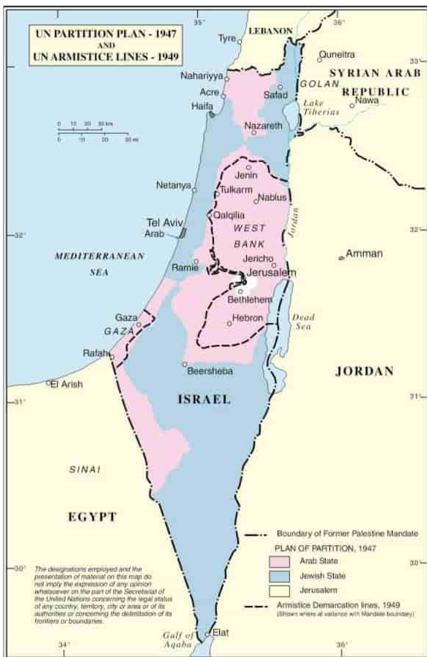
Partition plan, UN 1947, with '49 armistice delineated

There were heated discussions about the borders. Some said stick to the Partition Plan borders, while Ben-Gurion argued strongly that they should say nothing about the borders, because it was his intention to capture territory outside the Partition Plan borders and include it in the state. His view was accepted by a vote of five to four in favor, with the four other members being absent. This vote is the origin of the story that "Israel has never defined its borders". Ben-Gurion went home on the evening of May 13 and completely rewrote the draft declaration of independence, removing all references to the Partition Plan.